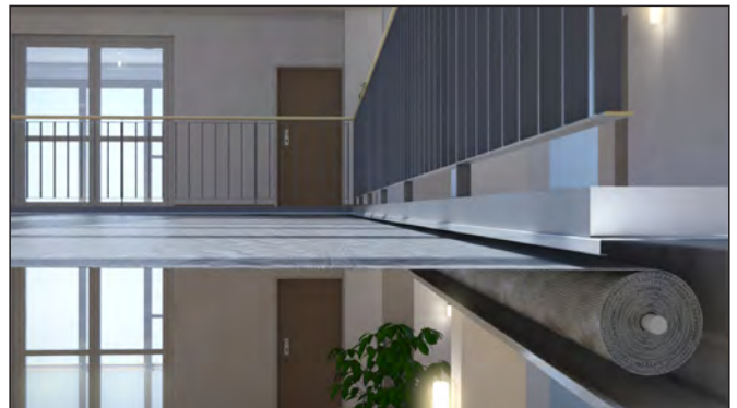
Im Brandfall fährt der bewegliche Gehäuseteil über die Deckenöffnung und wickelt dabei das aufgerollte Gewebe ab

Der Fibershield-HC erzielt die nach DIN EN 13501-2 klassifizierten Feuerwiderstände E 120, also einen Raumabschluss über 2 Stunden sowie EW 60, einen Raumabschluss mit reduzierter Wärmestrahlung über 60 Minuten.